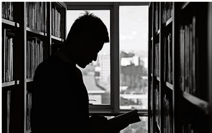
Rund 50'000 Menschen im Aargau sind vom sogenannten Illiterismus betroffen.

Ab dem 14. Februar findet in der Stadtbibliothek Aarau jeden Donnerstag die SchreibBAR statt. Dort erhalten Besucher Unterstützung beim Lesen und Schreiben. Auch für andere Fragen stehen die professionellen Kursleiterinnen und Kursleiter zur Verfügung.