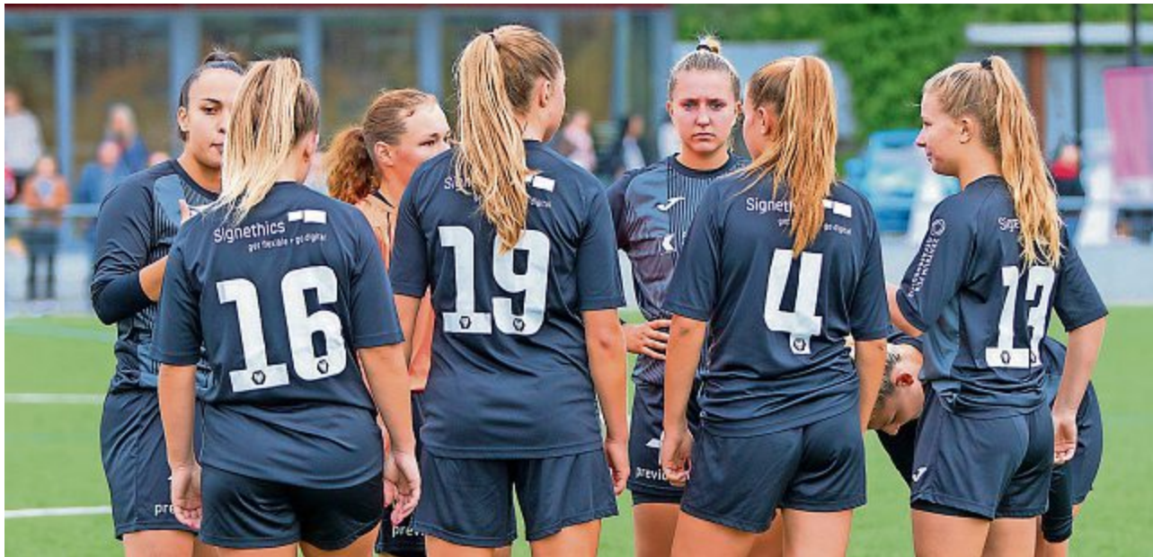
Sie sind jung und siegeshungrig: Die Frauen des FC Aarau sind bereit für die Rückrunde.