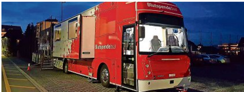
Neuer Blutspendebus in Schöffland.

Region Blut ist kostbar. Bei Unfällen, Operationen oder auch zur Behandlung von Krebspatienten wird Blut dringend gebraucht. Und da Blut nach wie vor nicht künstlich hergestellt werden kann, muss der Bedarf durch freiwillige Blutspendendeckert werden. Deswegen führt der Samariterverein Schöffland drei