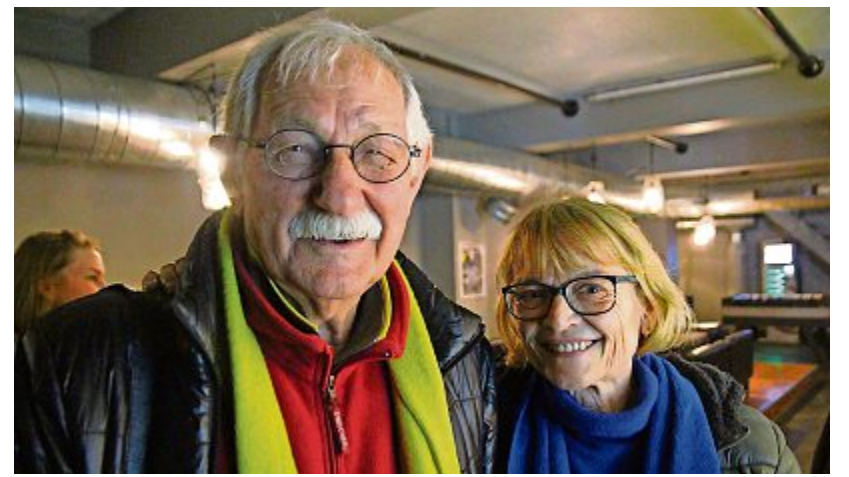
Aarau Am Samstag, 2. Februar, war im KIFF Open Club Day.