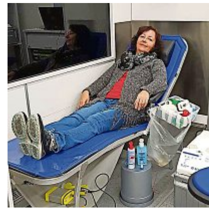
Die Chefin auf dem Blutspende Bett.

vom Samariterverein Schöffland im Jahre 1954 organisiert. Weltweit